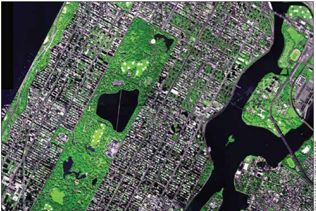
Image aérienne aux couleurs renforcées de New York, États-Unis d'Amérique. La structure et les avantages des forêts urbaines et périurbaines varient en fonction des paysages comme le couvert forestier et les populations humaines varient

Les informations sur la structure forestière peuvent être utiles aux gestionnaires en montrant la composition des espèces, la taille et l'emplacement des arbres et les dangers potentiels liés à la forêt (par